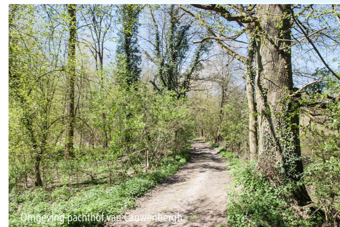
Omgeving pacht Hof van Cauwenbergh

De kapel werd gebouwd in 1909 en is opgedragen aan Onze-Lieve-Vrouw van Lourdes . Ze werd in 2004 grondig gerestaureerd. De eigenares van de grond onderhoudt de kapel; ze vertelt dat haar toenmalige verloofde (later haar echtgenoot) zich voor de Duitse bezetter in de kapel verstopte. In de muur achteraan de kapel was een mangat (nu verdwenen) gemaakt als vluchtweg, indien nodig.